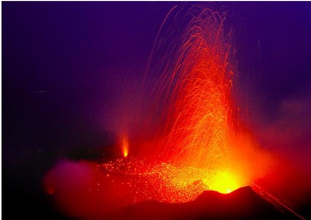
Strombolian eruption at Stromboli

Dernière actualisation: 20. janvier 18 / version française (si aucune traduction est disponible, la version originale anglaise est affichée.)