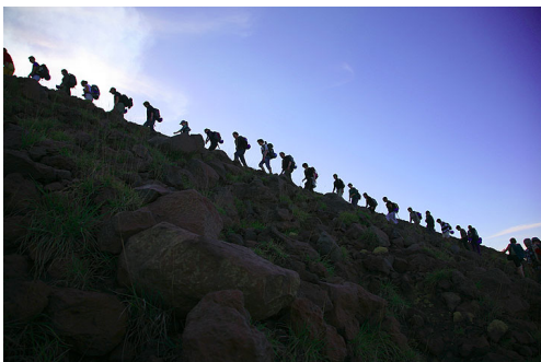
Group climbing Stromboli