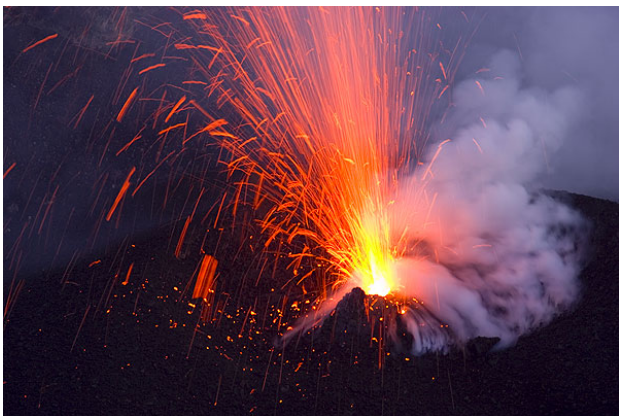
Lava fountain from a vent inside Stromboli's crater