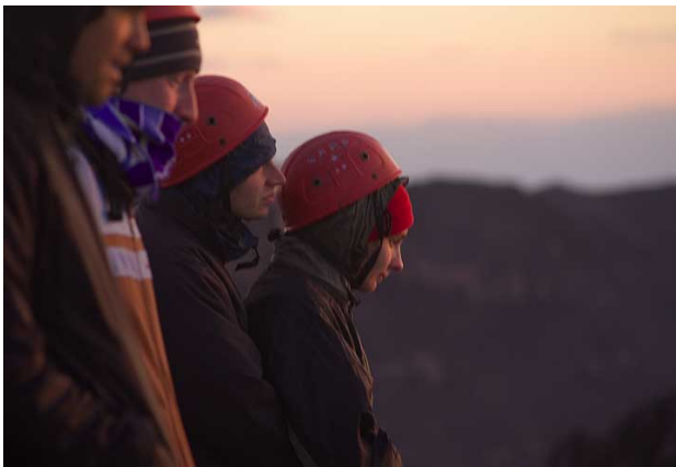
Watching Stromboli's craters